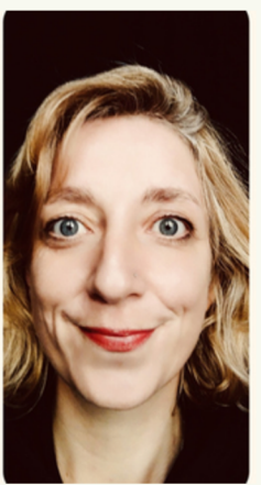
Marine Larnaud Scénographie